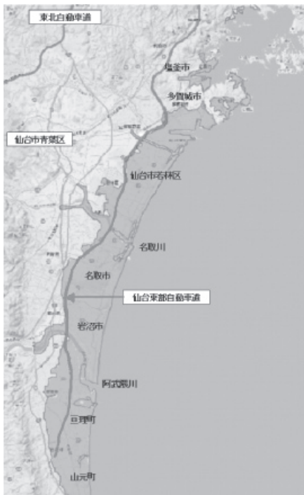
① 浸水区域(国土地理院資料より作成)