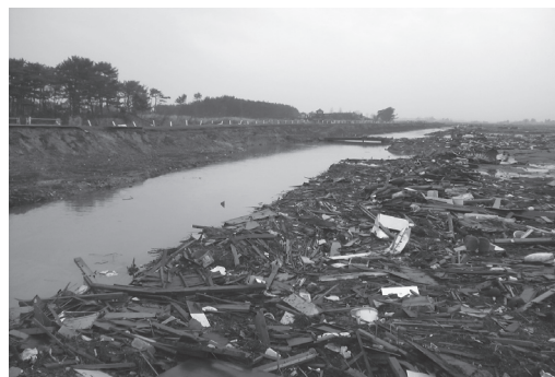
③ 藤曾根排水機場(宮城県岩沼市)。左:仮設ポンプによる排水、右:排水路に集積した瓦礫